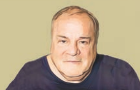
Γράφει ο Ανδρέας Μαζαράκης

Εάν εξετάσουμε χωρίς προκαταλήψεις τη διαδικασία που οδήγησε στην πρωτοφανή ρωσοτουρκική προσέγγιση των τελευταίων ετών, θα δούμε ότι –κατά φαινομενικά σχιζοφρενικό τρόπο– προέκυψε ως έμμεσο αποτέλεσμα της όξυνσης των σχέσεων τους μετά την κατάρριψη του βομβαρδιστικού Sukhoi Su-24.