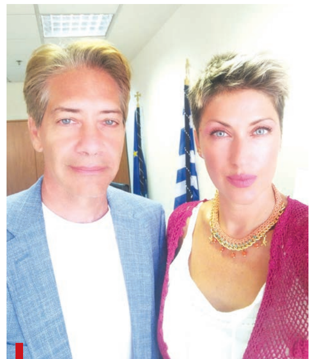
Ο Γενικός Γραμματέας Φυσικού Περιβάλλοντος και Υδάτων Πέτρος Βαρελίδης με τη δημοσιογράφο της «ΤΡ» Μάρθα Λεκκάκου

θανότατα θα είναι καθαρότερο από πολλά νερά που πίνουμε σε όλη τη χώρα.