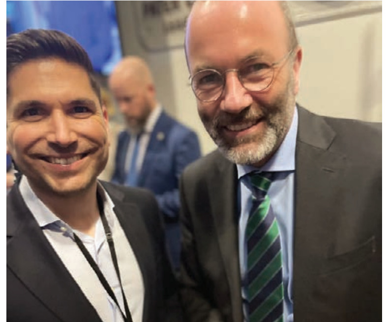
Ο διευθυντής της ΤΡ, Κώστας Λασκαράτος, με τον πρόεδρο του ΕΛΚ, Μάνφρεντ Βέμπερ.

Οι νέοι κανόνες αποσαφηνίζουν τις υποχρεώσεις που θα έχουν στο εξής οι κατασκευαστές σχετικά με την επισκευή των προϊόντων τους και θα ενθαρρύνουν τους καταναλωτές να παρατείνουν τη διάρκεια ζωής των αγαθών τους. Υποχρέωση των κατασκευαστών είναι πια να επισκευάζουν τα προϊόντα τους σε λογικές τιμές και μέσα σε εύλογο χρονικό διάστημα μετά τη λήξη της νόμιμης εγγύησης. Διαδικτυακές πλατφόρμες θα βοηθούν τους καταναλωτές να βρίσκουν καταστήματα που προσφέρουν επισκευές και ανακατασκευασμένα προϊόντα.