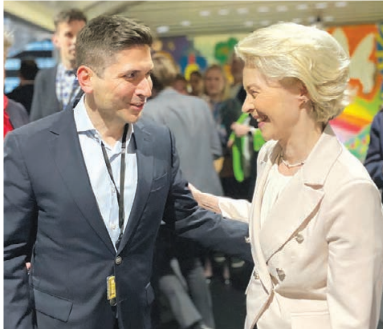
Ο διευθυντής της ΤΡ, Κώστας Λασκαράτος, με την Πρόεδρο της Ευρωπαϊκής Επιτροπής, Ούρσουλα φον ντερ Λάιεν

Οι νέοι κανόνες, θεσπίζουν την πανευρωπαϊκή κάρτα αναπηρίας, η οποία θα διασφαλίζει ότι τα άτομα με αναπηρία έχουν ίση πρόσβαση σε προνομιακούς όρους, όπως μειωμένα ή μηδενικά τέλη εισόδου, πρόσβαση κατά προτεραιότητα και πρόσβαση σε ειδικές θέσεις στάθμευσης. Η Ευρωπαϊκή Κάρτα Αναπηρίας θα εκδίδεται και θα ανανεώνεται δωρεάν. Όσοι μετακινούνται προσωρινά σε άλλη χώρα της ΕΕ για σπουδές καλύπτονται επίσης από τους νέους κανόνες