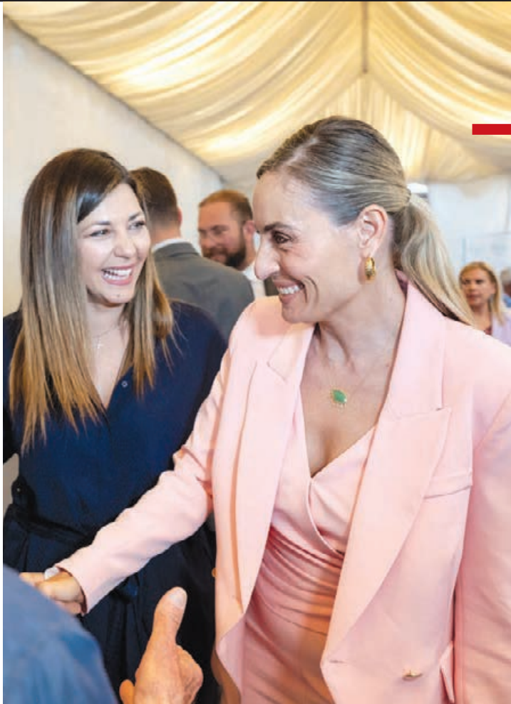
Η Ελεονώρα Μελέτη με την Υπουργό Κοινωνικής Συνοχής και Οικογένειας Σοφία Ζαχαράκη.